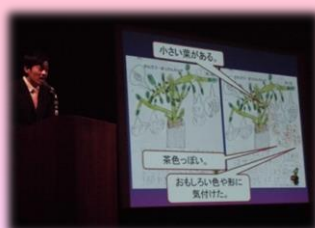
後藤 宗 (桶狭間小) 小2 生活科